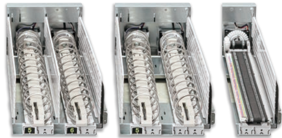
シングル スパイラル